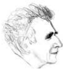
Vladimir Dimitrijević dessin de Cvetko Lainović